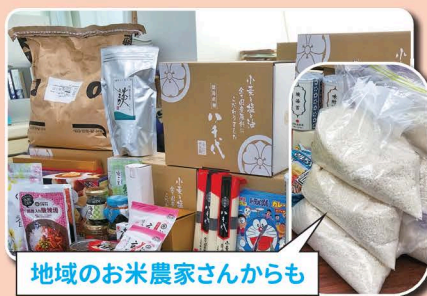
地域のお米農家さんからも

フードドライブは、ご家庭で余っている食品をご寄付いただき、生活に困窮している方々へとお配りする活動です。