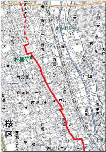
西堀を通る与野道

土合の地域内には鎌倉街道の与野道という枝道が通っています。与野の追分から南下するこの道を散歩しながら歴史を感じるのも楽しいものです。